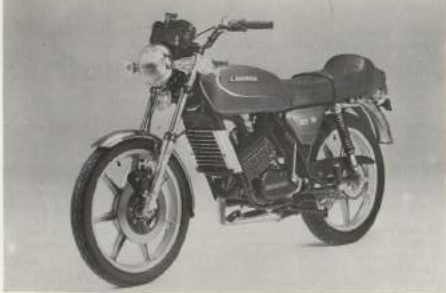
- LAVERDA 125 LZ - (175) 5 marce, telaio tubolare a doppia culla, raffreddamento a liquido, accensione elettronica, super cockpit con contagiri elettronico e contachilometri, lampeggiatore quadruplo.