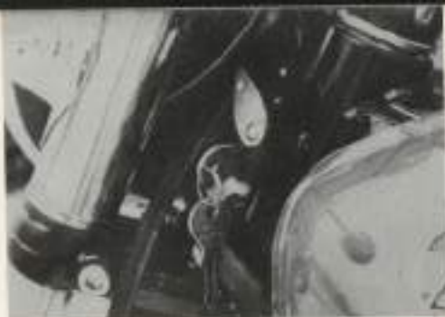
Fig. 4 - Bloccasterzo

In condizione atmosferiche fresche è in genere sufficiente percorrere circa 1 Km. Quando il motore è già caldo lo starter non è necessario.